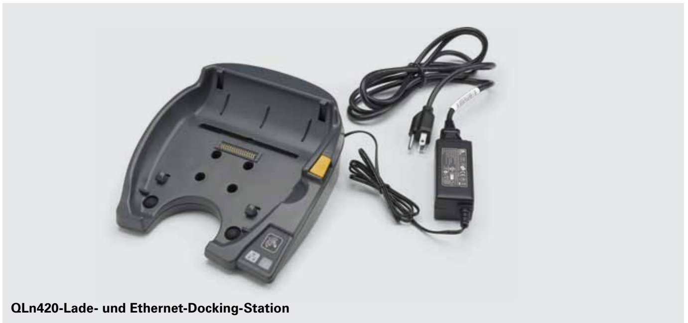
QLn420-Lade- und Ethernet-Docking-Station